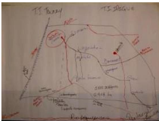
Tribo indígena Taunay-Ipegue