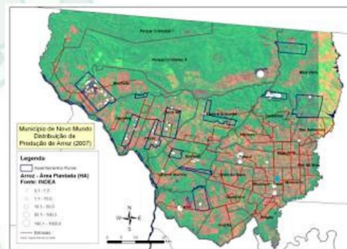
Município de Novo Mundo - MT